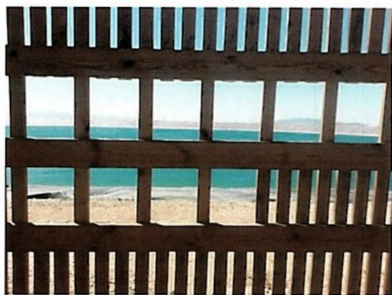
מאגר סירין - הציפורים לא מגיעות

אריק: אנחנו במשא ומתן עם המדינה, ואני מעריך שזה יקרה בתוך שנתיים-שלוש 'מרגע' הישמע הגונגי, אבל יש עוד מכשולים בדרך.