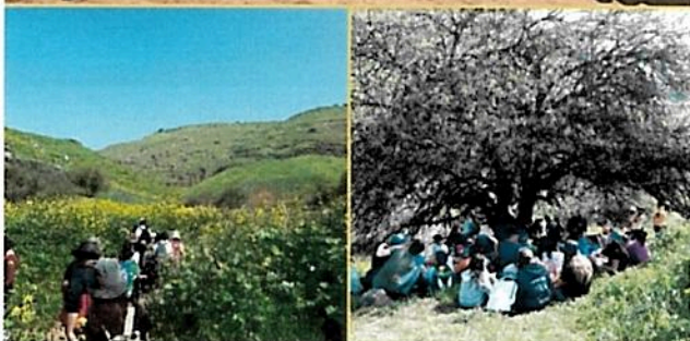
שכבה צעירה (ז-ח) בנחל תבור