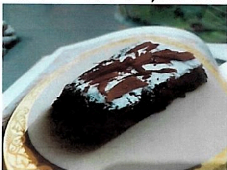
עוגת שוקולד ואגוזים לפסח: