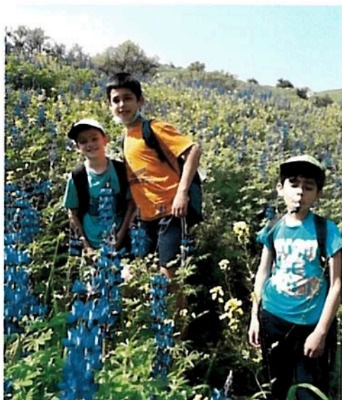
ה-ו בנחל תבור

בהחלט נידרש לתקופה זו. מבקש להודות פעם נוספת לציבור ההורים על האמון שהוא נותן במערכת החינוך החברתי. למדריכים המסורים והנאמנים של המערכת שנאלצים לעבור בכל פעם מחדש טלטלות ביציאה/חזרה מהחל"ית.