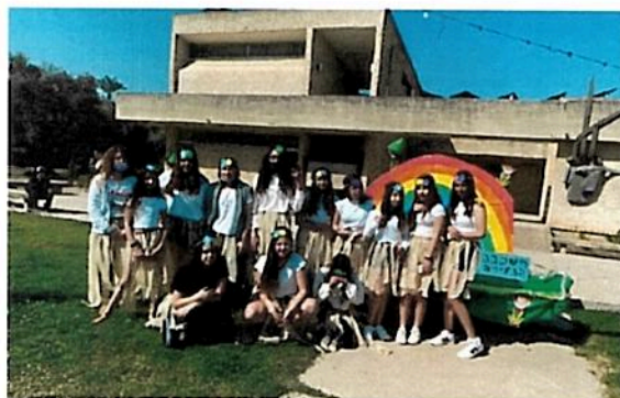
השכבה הצעירה בעגליאדע