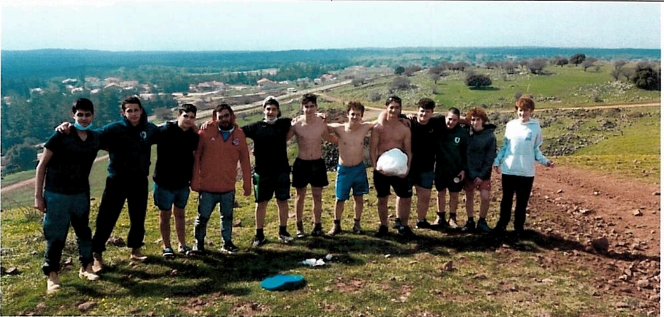
חברת נעורים בהר אודם (עם כדור שלגי!)