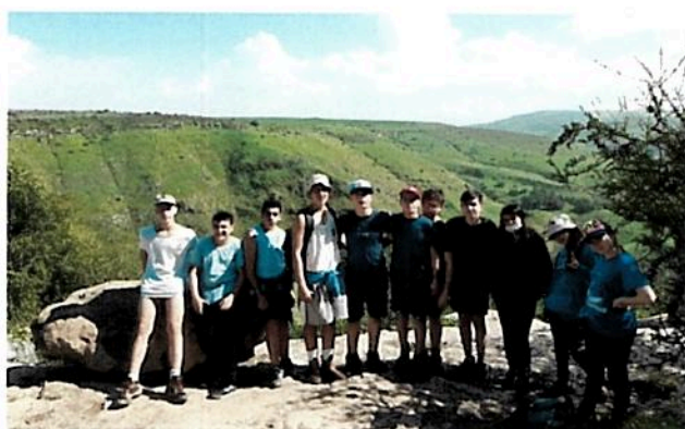
שכבה ח' בנחל תבור