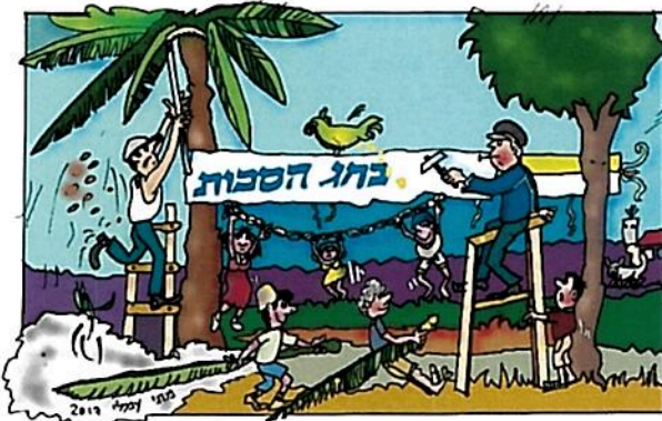
כתב וצייר - מתי עמלי - כרכור י"ז-תשרי- תשע"ח 07/10/2017

נכון, אמצנו בשמחה את מנהג ה"אושפיזין", שמקורותיו מהקבלה היהודית. מותר לתהות האם מנהג זה שונה מהטקסים שבטי האמזונס מקיימים, לרוחות של אבותיהם? נראה לי שלא. כך הפך עבורי סוכות לחג בו מועלה זיכרון הורינו, והדורות הקודמים.