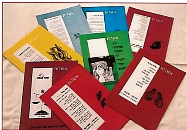
צילום עלוני אשדות הנוכחיים – עמוס גל

עלון אינפורמציה בעיקרו אבל משמש גם ביטוי לחברים בשאלות שונות של חיינו המשקיים והחברתיים. גדול ערכו של היומן לחבר הותיק כי הוא עוזר לו להקיף במידת מה את המשק בכל רב-גוניתו ובכל צדדיו – הענפים, הצורות השונות של עבודת חוץ, מוסדות המלאכה, מוסדות הבית, החינוך,