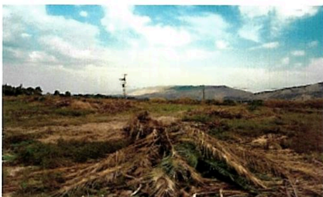
סוף בעמוד הבא

לא נעים לראות גן סגור, ועוד פחות נעים לראות מטעי תמרים זקופים וחיוניים שהולכים ונעלמים בימים אלה מנוף מטעי אשדות, משיקולים כלכלים גרידא. מה שישאר לשנים הבאות לאחר העקירות, הוא הזן הצהוב ברהי שמראה רווחיות. השטחים שהתפנו ומתפנים יוסבו לגד"ש.