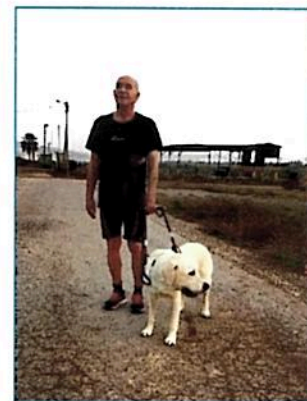
פרח: בזכות הספורט השתקמתי

שגרמו הרסיסים שחדרו לגופי. התחננתי למנת מורפיום כדי שאוכל לישון קצת. משם הובלתי במסוק לשדה התעופה ביר-גפגפה ואח"כ במטוס אזרחי לנתב"ג (אז שדה התעופה לוד) ולפנות בוקר באמבולנס לתל השומר. האיש שניתח אותי היה פרופסור שטיין-רופא עיינים מדהים, שהסביר לאשתי שהושתלה לי קרנית, ומחכים לראות תוצאות, למרות שבתוך תוכו ידע כנראה שהסיכויים לכך שואפים לאפס, משום שהרסיסים שפכו לי את שתי העיניים. הקרב שבו איבדתי את ראייתי, מסכם פרח, היה עקוב מדם. נפלו בו 14 לוחמים ועשרות רבות נפצעו. איש כמעט לא יצא שלם מהקרב הזה.