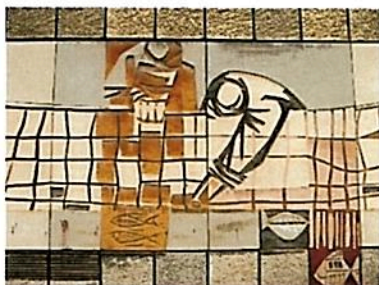
כתב: שי פרקש

בשנים האחרונות התמקד אריק בפרדוקסים במאה ה-21, כפי שניתן לראות בסדרת הציורים שלו "Garbage of the Western World".