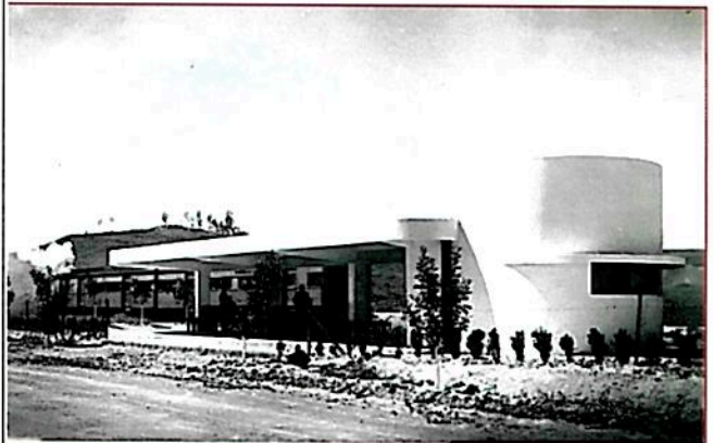
תחנת הרכבת של נהריים - הכסף הוחזר לתורמים

'אי השלום' הוא כינויו של שטח שגדלו 830 דונם, שבעקבות הסכם השלום עבר לריבונות ירדנית והוכרז בו 'משטר מיוחד' שמשמעותו שהשטח הריבוני שייך לירדן תחת אחריות הצבא הירדני, בעוד השטחים החקלאיים שהם על פי ההסכם בבעלות פרטית ישראלית, מעובדים על ידי חקלאי אשדות יעקב. ההסכם מאפשר ביקורים באי השלום ללא אשרת מעבר. באופן זה נכנסה בשנת 97 קבוצת תלמידות מבית שמש, ששבע מהן נרצחו מכדוריו של חייל ירדני ואחרות נפצעו.