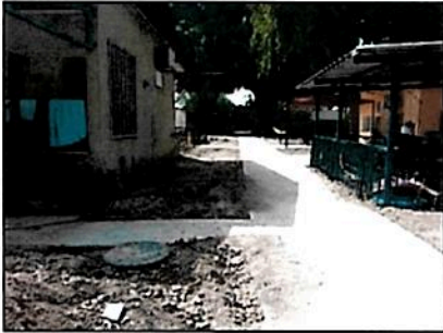
זרועה בבורות, מכסי ביוב ושאר מרעין בישין האורבים לקורבן בא.