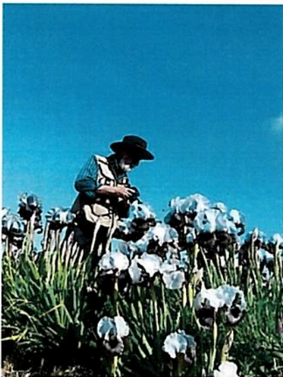
אירית, רות, מוכן ופני האשכחה