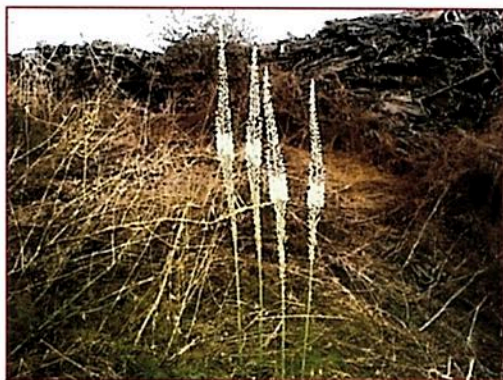
אבנרון ואירית גל עלון אשדות

שתהיה לכולנו שנה טובה עם הרבה כבוד הדדי!