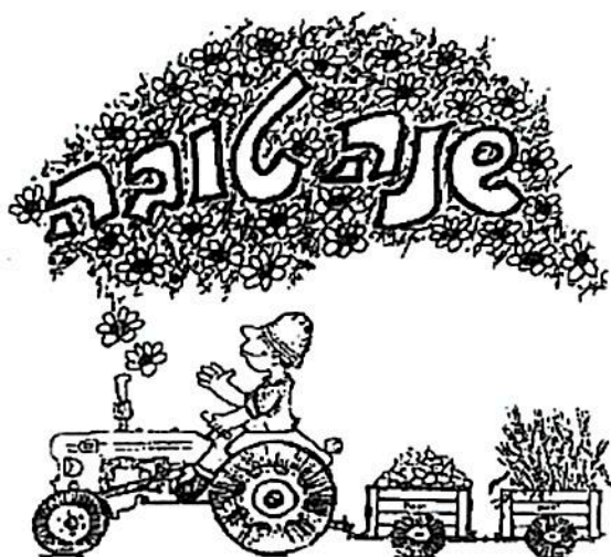
"...שלוש לעלמי העץ"