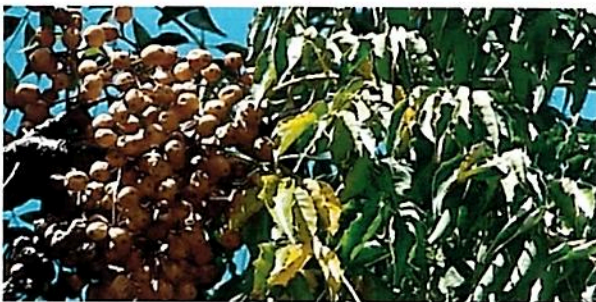
סוף בעמוד הבא

עץ האזדרכת ממלא חורשות בישראל ונמצא גם בין בתינו. כל חלקי העץ רעילים ומסוכנים, הריכוז הגבוה ביותר של הרעל הוא בפירותיו הצהובים המזכירים במראם שילוב של ענב ותמר.