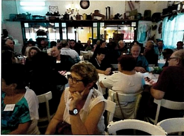
אחוות כדורסלני עבר