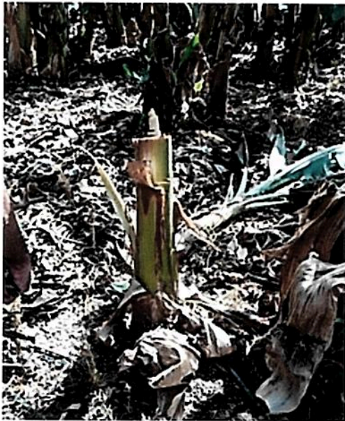
נצרי בנות שהושמדו