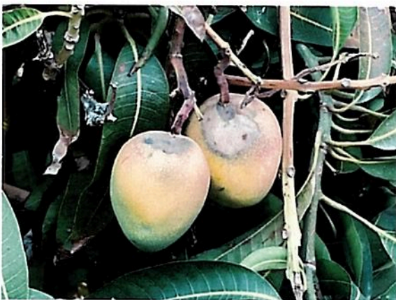
מנגו שנוצר בשרב