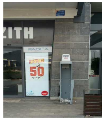
שבת שקטה- יונתן שטיינדל רבש"צ