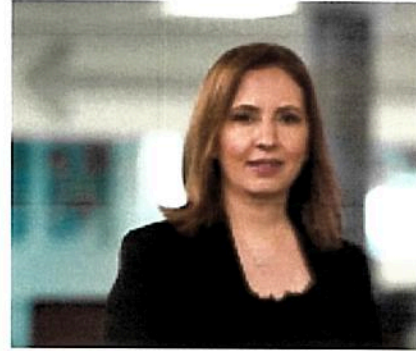
השרה להגנת הסביבה, גילה גמליאל

הסכנה מחריפה לנוכח התגברות משבר האקלים העולמי. "מינים פולשים הם הגורם השני בחשיבותו לאובדן המגוון הביולוגי, אחרי אובדן שטחים פתוחים", אומרת ציפי סבג-פרידקין ממשרד החקלאות. "בעקבות העלייה בהיקף הסחר העולמי במאה השנים האחרונות חלה עלייה דרמטית בקצב התפשטות המינים הפולשים ובנזקיהם. שינויי האקלים, הצפויים להקצין בשנים הקרובות, עלולים להחמיר מגמה זו".