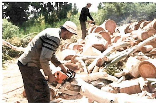
כריחת עצי אקליפטוס

שמאיימת על ענף התמרים. מעבר לפגיעה ביבולים הטיפול בפולשים מגדיל את עלויות החקלאים ופוגע ברווחיות. מינים פולשים עלולים לגרום גם לצריכה גדולה יותר של מים, דשן ועוד. הפגיעה הבריאותית כתוצאה ממינים פולשים כוללת טיפול תרופתי וימי אשפוז (בדוח לא נלקחו בחשבון עלויות מקרי מוות או אובדן ימי עבודה). אבל לא רק בבעלי חיים עסקינו, אלא גם בצומח, ולעיתים במינים שנמצאים בארץ כבר שנים רבות והם חלק מהנוף היומיומי שלנו, כמו אקליפטוס, דקל וושינגטוניה, פיקוס, ועוד.