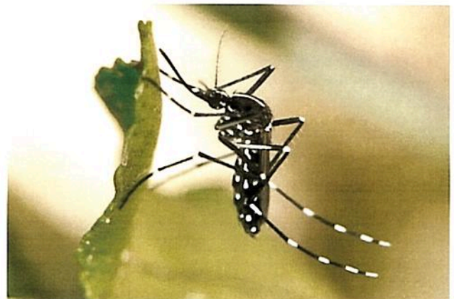
הטיגריס האסייתי

עוד מחלה שנגרמת על ידי עקיצת היתוש, ושממנה אנחנו כן סובלים בארץ, היא קדחת הנילוס המערבי , שגורמת לדלקת קרום המוח ולדלקת המוח. "לגבי מניעת הגעתו של הטיגריס האסייתי זה כבר אבוד לנו, הטיגריס איתנו ומפושט", אומרת זגרון. עכשיו נשאר רק להילחם בו ולמזער את הנזקים.