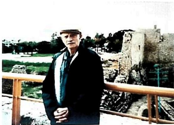
הפסל מאיר ארמן

מאיר ארמן 1923-1998, נולד בעירה אופטוב שבפולין למד בבית ספר עברי ושלט בשפה העברית עוד בטרם עליתו ארצה. כניצול שואה הגיע ארמן לקיבוץ גשר בקבוצת 'המורד' על סיפון אונית המעפילים אנצו סירני, עבד כרועה צאן ואחרי שעות העבודה התמסר לתחביבו-הפיסול. בהיותו שומר שדות, נפצע ארמן במלחמת השחרור ואושפז לתקופה מה בבית חולים. לאחר המלחמה הצטרף אל אימו בקנדה לסייע לה בניהול המשק החקלאי המשפחתי, ובעיתות הפנאי המשיך באומנות הפיסול. שמו יצא לפניו ברחבי קנדה כפסל מעולה והוא אף נרתם ללמד את המקצוע בבתי ספר. למרות שעזב את הארץ בגיל צעיר, הקשר עם גשר לא פסק מעולם, ולאחר מות רעייתו, הגשים ארמן את חלומו, חזר לקיבוץ וחי בו עד יום מותו. ארמן הותיר אחריו מספר פסלים המקשטים את רחבי הקיבוץ ומוקדשים לזכרון השואה.