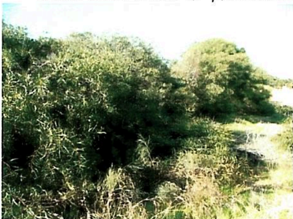
שיטה כחלחלה שמורת חולות ניצנים

עם כל הכבוד לצמחים, אומדן הנזק הגדול ביותר הוא מקבוצת פרוקי הרגליים – חרקים, עכבישים וסרטנים – שעלולה, לפי הדוח, להסב לנו נזק של כ-150 מיליון שקל. 32% מהנזק הכולל ממינים פולשים. הכנימה הצהובה , למשל, שמקורה בארה"ב, ניזונה מעצי פקאן. היא חדרה לישראל כנוסעת סמויה ביבוא לא חוקי של פקאן מארה"ב, והיא הגורם המשמעותי ביותר בחיסול ענף הפקאן בארץ. עלויות ההדברה שלה יקרות, והיא שחקה את רווחיות הענף עד להתמוטטותו ממש.