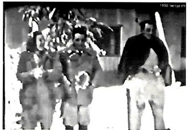
אנשי אשדות בשלג פברואר 1950

כשבוע מאוחר יותר, ב-6 וב-7 בפברואר, החל לרדת שלג כבד בכל רחבי הארץ. גובהו הגיע ל-60 ס"מ בצפת, ל-65 ס"מ בירושלים ול-17 ס"מ בחיפה. כמו כן ירד שלג בפתח תקווה, כפר סבא, נתניה והשומרון, בראשון לציון, רחובות ובהרי הנגב וכן סביב הכנרת . ב-8 בפברואר הגיע השלג גם לים המלח כאשר נערמו שם 8 סנטימטר של שלג.