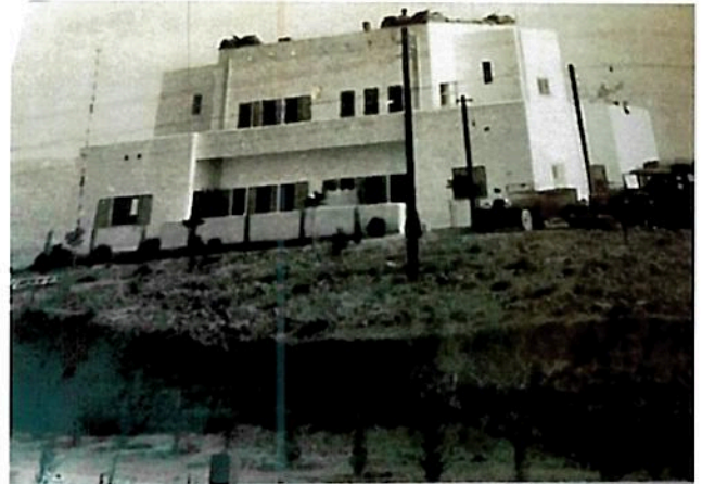
בית המנהל - החזית הדרומית - מערבית