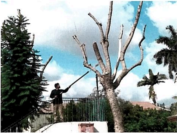
ובא לציון הכורת.