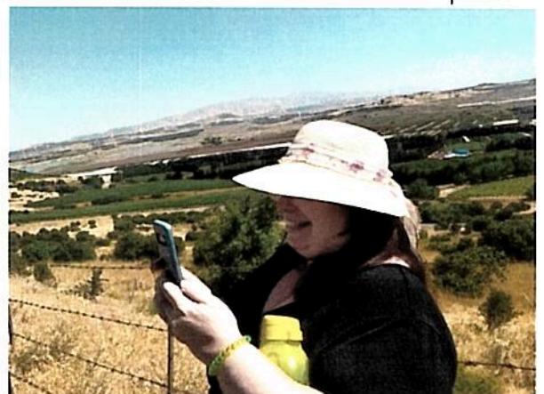
בקרוב צפוי ארוע דומה למגזר העיסקי אבנרון