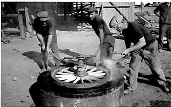
מימין: חנוך ראובני, משה תמיר (טבקרקה) וחיים מיידן