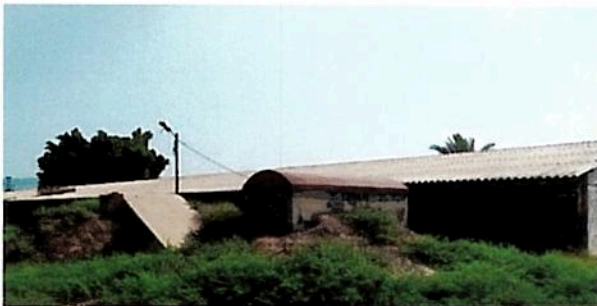
בונקר פצצות מרגמה