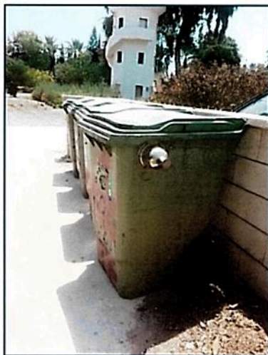
סוף בעמוד הבא

הפיתרון: קירגון. לעיתים קרובות קורה שהזבל במכולה ('צפרדעי'), העומדת ליד חדר האוכל, גולש עד גדותיה. לפעמים זה בגלל פעילות בחדר האוכל, לפעמים בגלל ניקיון בבתי הילדים וגם סתם כך. תושבי השכונה פנו אל מנהל עסקי הקהילה ותוך כמה ימים הגיעו 4 פחי אשפה ירוקים לתגבור, ומאז נראה שהצפרדע מעכלת בכבוד את כל המושלך אל קרבה. על כזה אמרו חז"לנו: 'זה נהנה וזה לא חסר'. (יונתן אלטר)