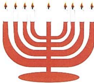
עלון 1572 – חנוכה תשפ"ב