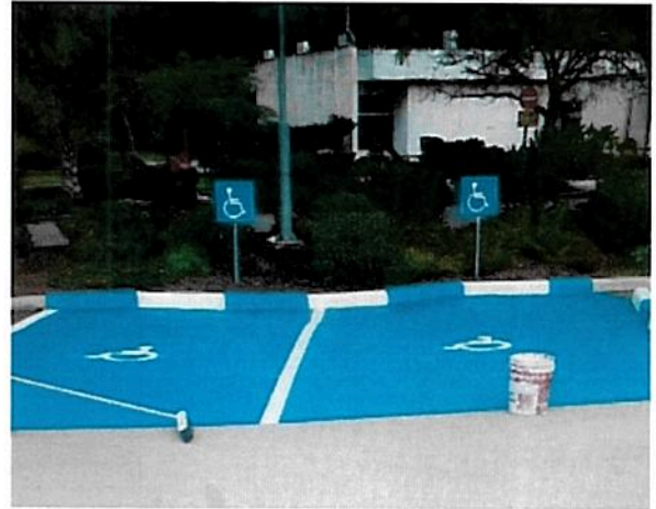
סוף סוף חניה גם לנכים

עלון 1543 עריכה ומי ומה – אבנר רון שער – ברכה פונדק עימוד – אירית גל צילום עלון – אתי רון