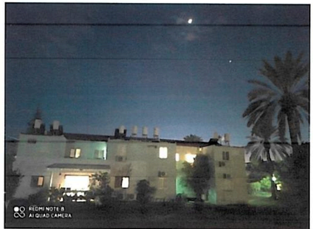
וכך נראים הנוגה והירח בשבוע החלל

ויש אחד בינינו שחרף גילו (כמעט 70) והיסטוריה לבבית עשירה, שהוא נושא עימו, ממשיך בוקר בוקר וערב ערב לפקוד את היונקים ברפת אשדות מאוחד, כדי לערוב לבריאותם וחוסנם. הוא עושה זאת כבר עשרות שנים בצנעה, בשקט ובמסירות אין קץ, ומגיע לו שנפרגן לו כולנו. איציק גל.