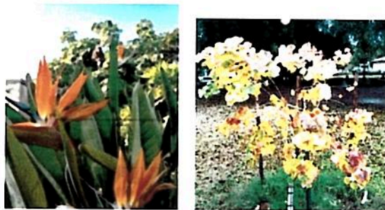
סוף בעמוד הבא

ועוד מסממני עונת המעבר (שכבר חלפה עם בוא הגשמים), הם העצים שבשלכת כמו זה שבתמונה שמשתלב היטב עם פרחי 'ציפור גן' עדין המייפים לנו פינות רבות בחצר הציבורית וגם הפרטית.