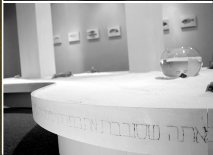
מראה הצבה אגן עץ, מלח מים המלח, אבני מלח מעובדות, אקווריום זכוכית, דג, צריכה, טכניקה מעורבת. 300X1005 ס"מ