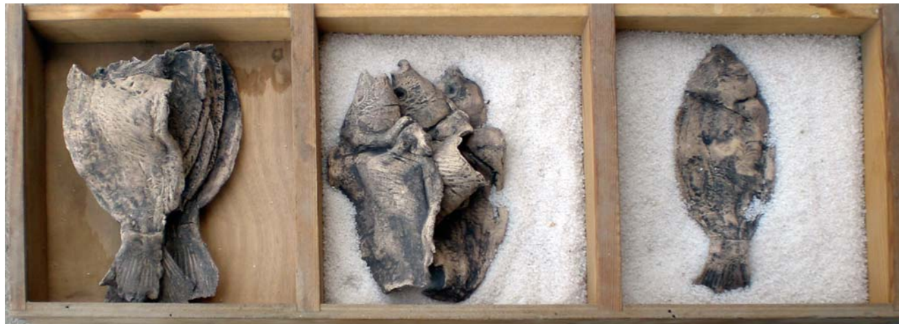
מראה הצבה קופסת עץ, מלח מים המלח, חומר, טכניקה מעורבת. 90X35X14 ס"מ