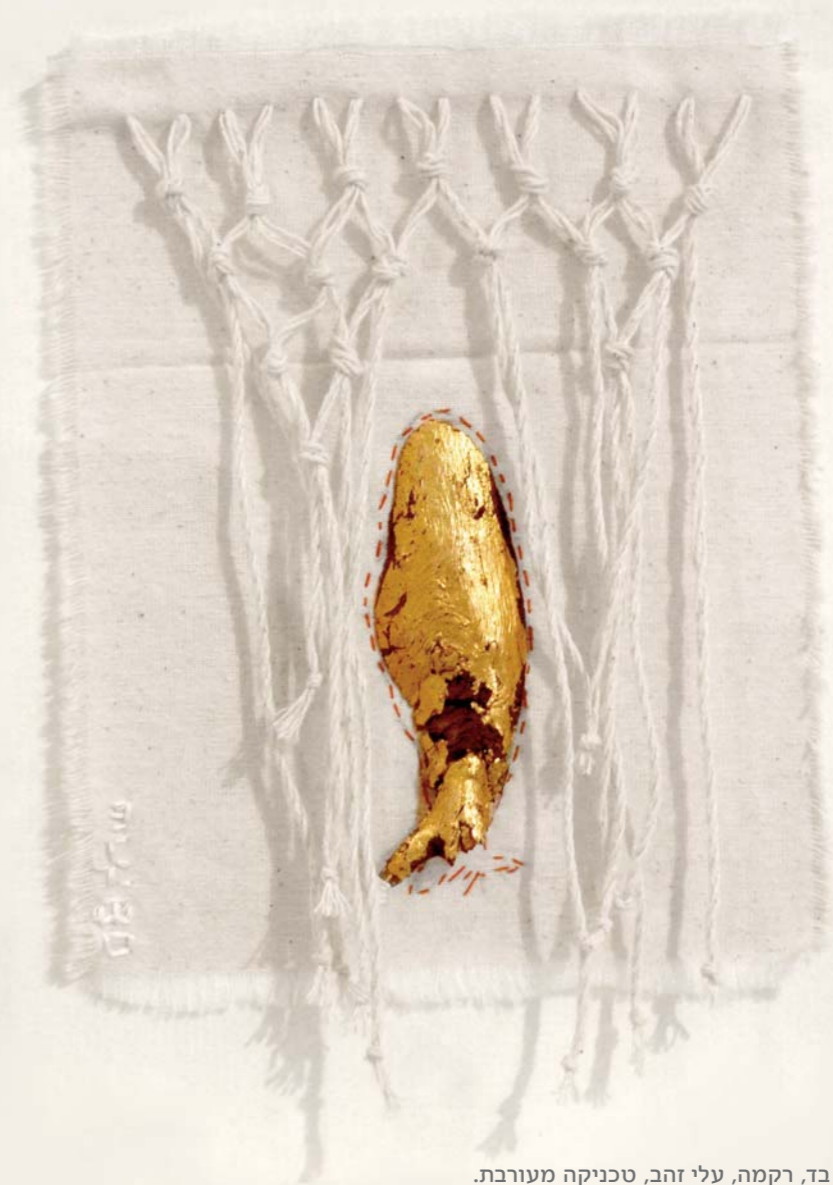
בד, רקמה, עלי זהב, טכניקה מעורבת. 29X32 ס"מ