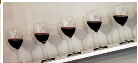
מראה הצבה כוסות זכוכית, יין, פורמייקה, טכניקה מעורבת. 300X12X19 ס"מ