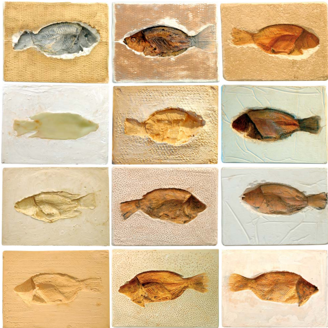
יציקות גבס, צבע, שעווה, סיליקון, טכניקה מעורבת. 38X28X6 ס"מ