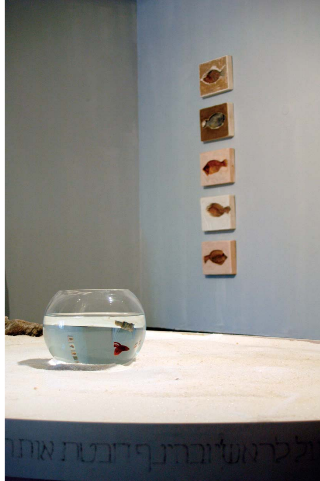
מראה הצבה (מימין) מלח מים המלח, אבני מלח מעובדות, אקווריום זכוכית, דג, צריבה, טכניקה מעורבת. 1050X300 ס"מ